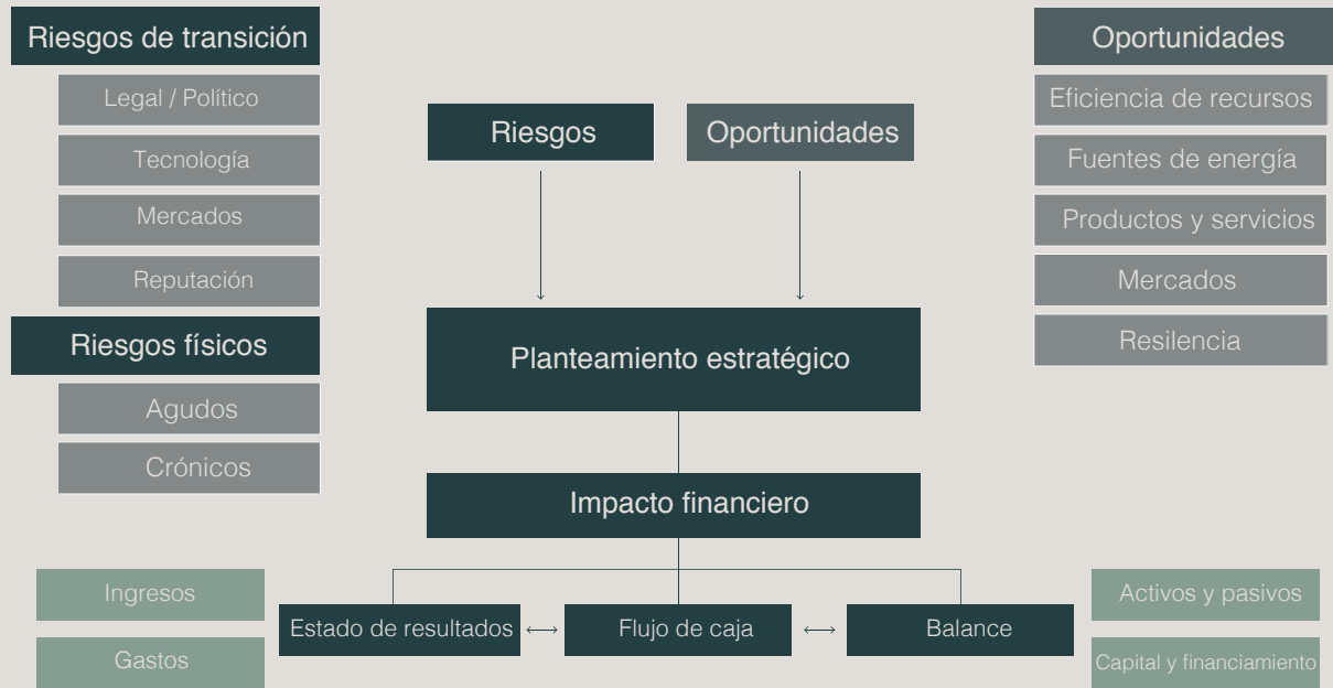
Figura 1. Riesgos y oportunidades asociados al cambio climático